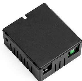
RF22227 Dimmer parete