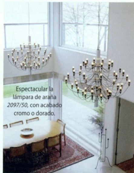
Espectacular la lámpara de araña 2097/50, con acabado cromo o dorado.