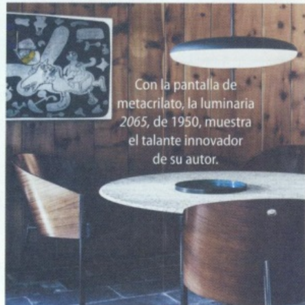
Con la pantalla de metacrilato, la luminaria 2065, de 1950, muestra el talante innovador de su autor.